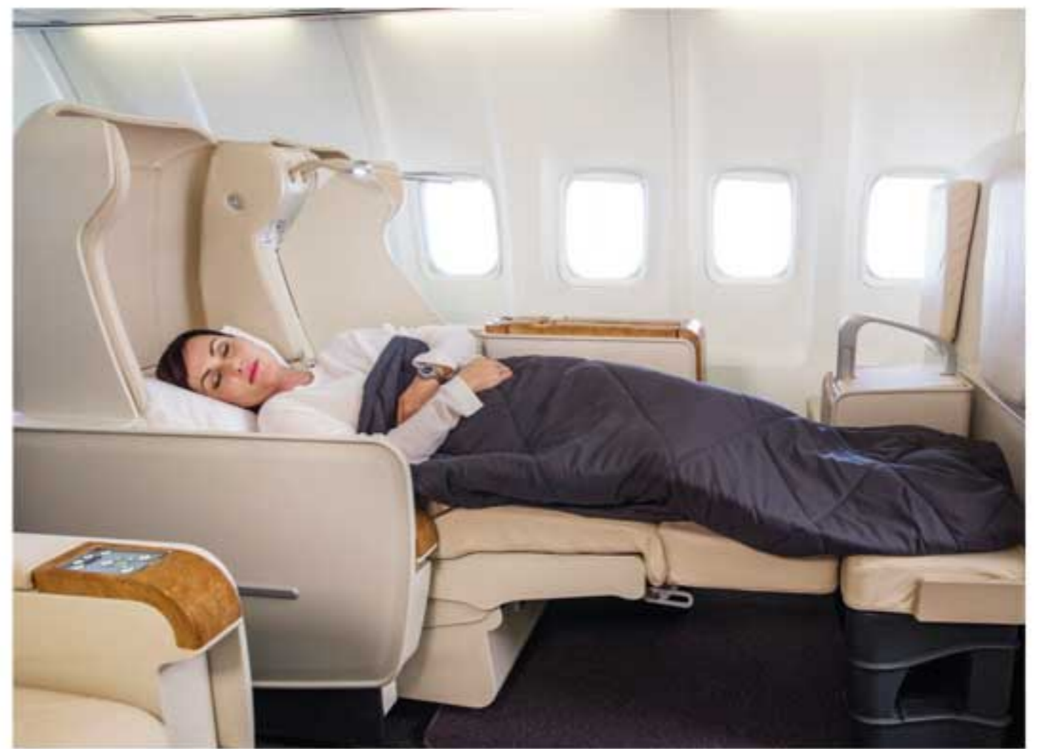
Business-Class-Sitze mit 180°-Flatbed-Funktion