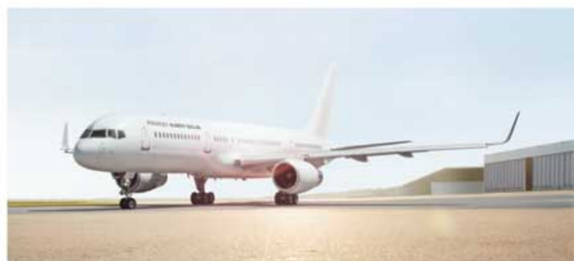
Boeing 757-200 mit VIP-Ausstattung